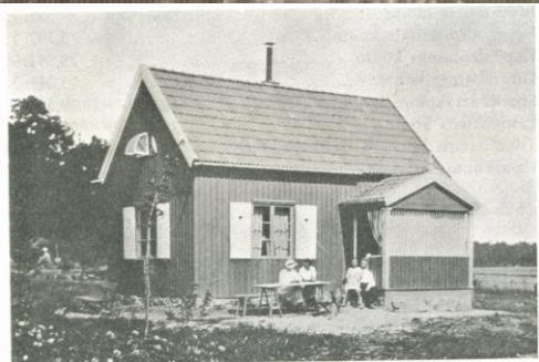
Medlem Tell i solen utanför sin sommarstuga.