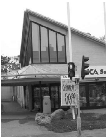
Ica sponsrar midsommarfirandet i Bromma Kyrka.