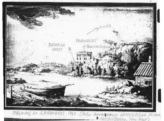
På bilden av Marieberg från 1764 ser man taket på huset som nu finns på Rundkyrkoallén sticka upp. Numera ligger ryska ambassaden strax intill till vänster och Västerbron till höger.