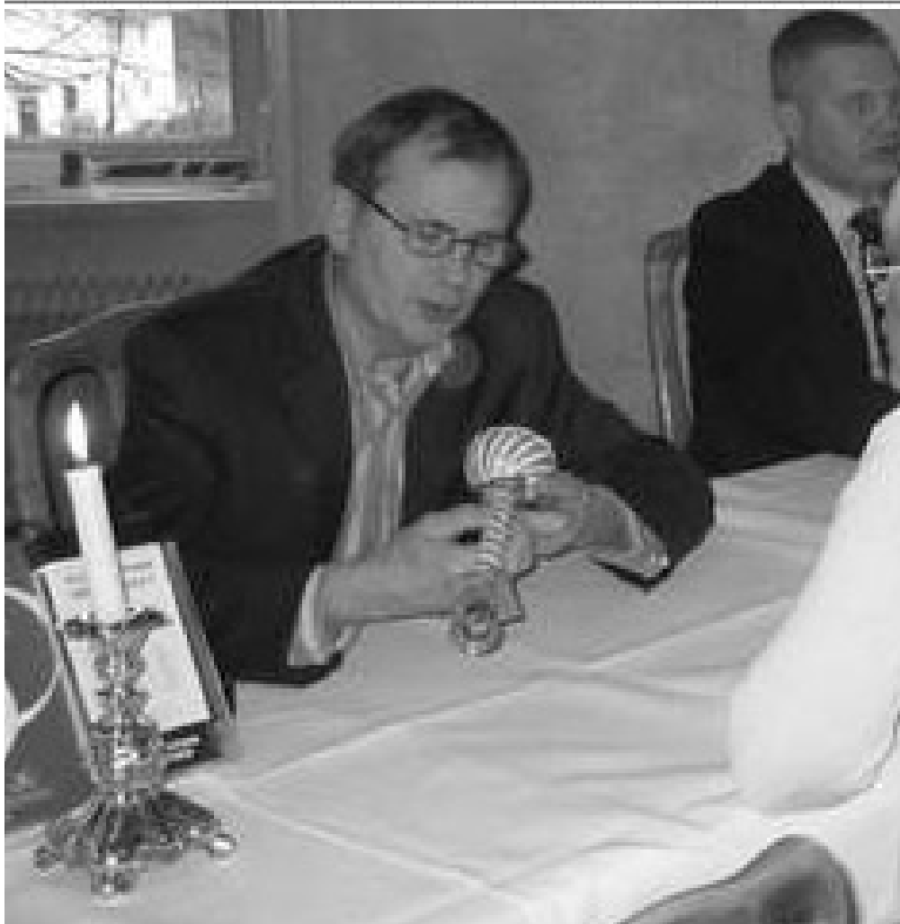
Här studerar Stockholms Auktionsverks experter föremål som boende i vårt område ville veta mer om. Flera bokade också hembesök för att få sina saker värderade.