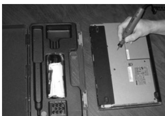
Låna märkpenna hos Grannsamverkan.

Anmäl i så fall din e-postadress till ditt kontaktombud, eller om sådan saknas, till ditt huvudkontaktombud. Du kan använda blanketten som kommer att delas ut.