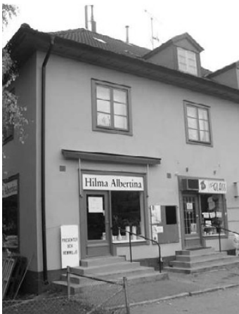
Hilma Albertina och cafeet på Spångavägen bidrar också till midsommarfesten.