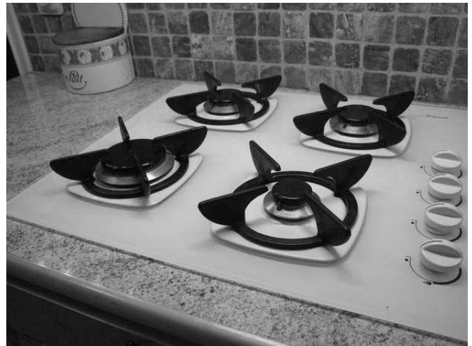
En del villaägare i Bromma kyrka har haft tillgång till stadsgas. Men nu har Fortum bestämt att lägga ner hela gasnätet.

Lägg signalement på minnet samt eventuella fordon och registreringsnummer.