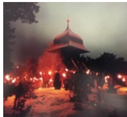
Vid klockstapeln för 25 år sedan. Läs mer i Jubileumsskriften

Fackeltåg till klockstapeln på nyårsafton börjar bli en gammal tradition. Som vanligt samlas vi på parkeringen framför kyrkan vid Gliavägen vid 23.30-tiden. Föreningen köper in ett antal facklor, men ta gärna med egna.