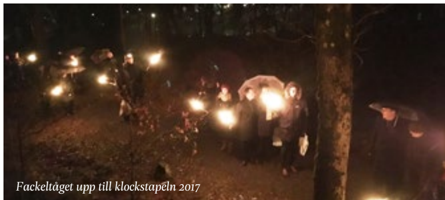
Fackeltåget upp till klockstapeln 2017