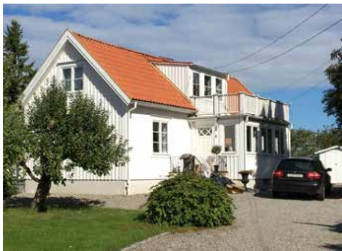
Lillängsgatan 4. Här bor idag sedan 14 år familjen Widholm.