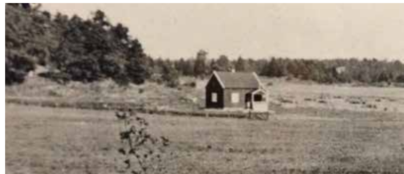
Ursprunghuset på Lillängsgatan 4. Till höger syns Bällstalundsskolan och bakom huset skymtar Bällsta kvarn på sin ursprungliga plats. Bilden är troligen från 1921.