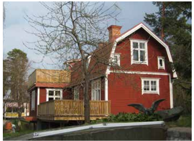
Bällstavägen 185 på bild från 2018. Huset är tillbyggt mot Kyrkoherdevägen dvs. bortåt i bild.