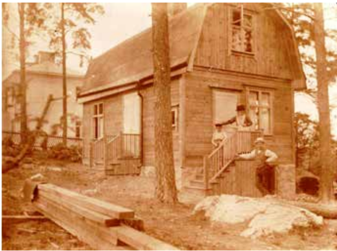
Familjen Almströms sommarbostad på Bällstavägen 185 år 1913. Bakom syns huset på Bällstavägen 187.

Text: Inger Larsson, Foto: Inger Larsson samt arkivbilder