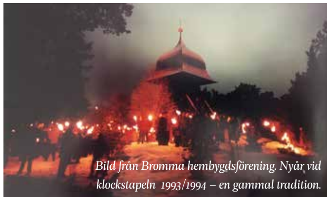
Bild från Bromma hembygdsförening Nyår vid klockstapeln 1993/1994 – en gammal tradition.

Föreningen köper in ett antal facklor, men ta gärna med egna.