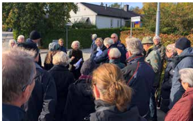
Korsningen med Bromma Kyrkväg. Huset i bakgrunden hade damfrisering i bottenvåningen på 1960-talet.

Mer info finns på föreningens hemsida www.brommakyrka-enebyvillaforening.se under Historik>Historiska bilder>Doktor Abrahams väg. Här finns bild och text om många av husen längs hela vägen ända bort till vägens slut i Eneby. Hittar du några fel eller vill lägga till något i bildserien så skicka ett mail till föreningens mailadress: info@brommakyrkaenebyvillaforening.se och berätta.