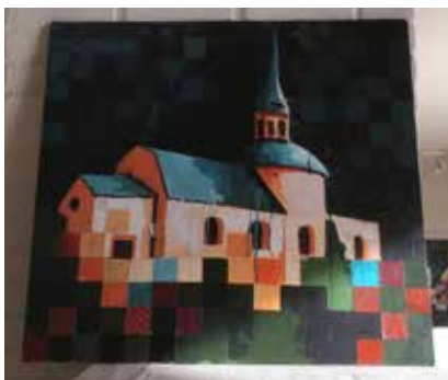
Konstverk av Cathrine Näsmark

Kyrkoherde Torbjörn Gustavsson guidar i kyrkan speciellt för föreningens medlemmar med anledning av kyrkans 850-årsjubileum. Välkomna till detta evenemang. Vänner och gäster är förstås också välkomna.