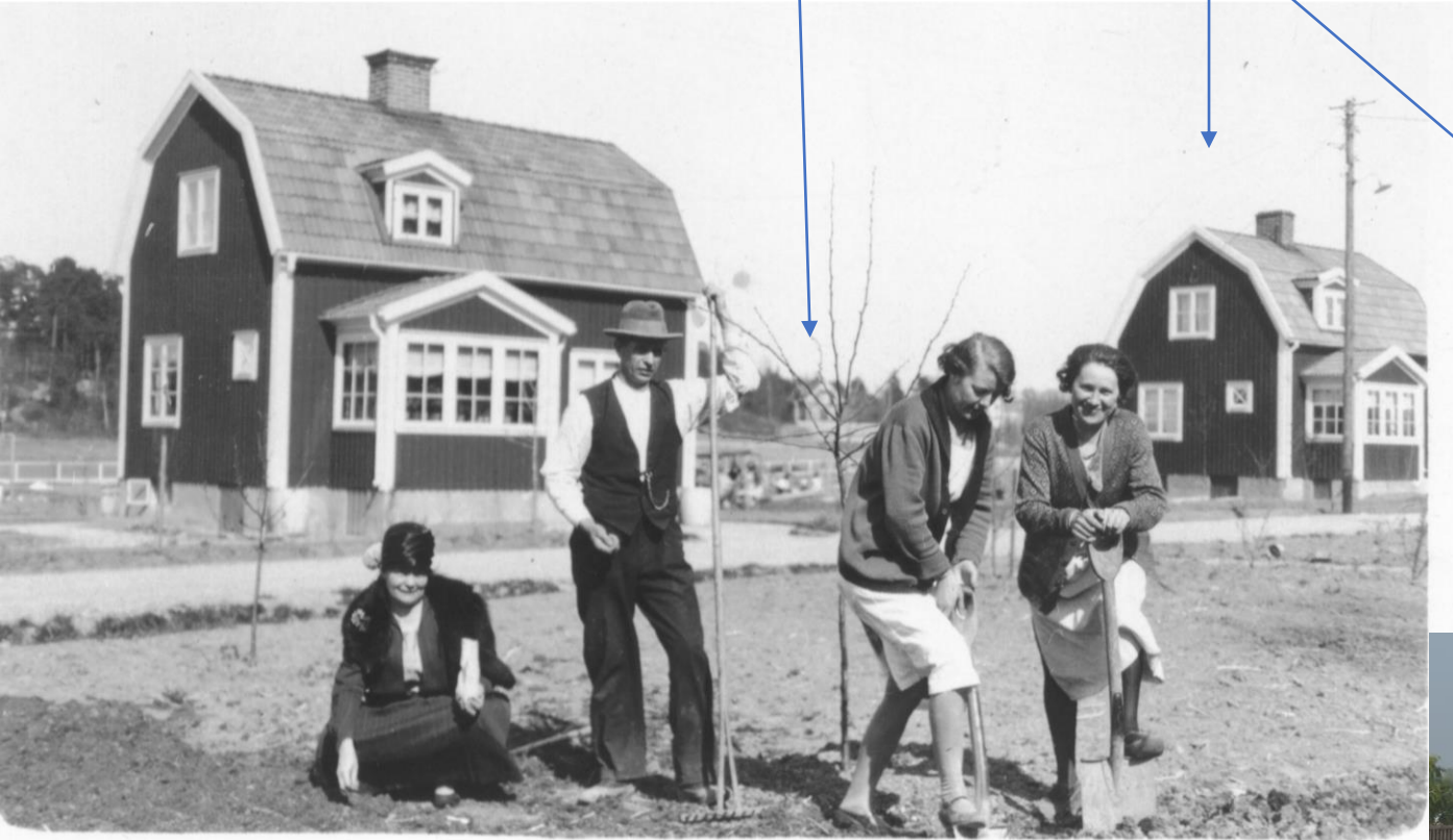
Trädplantering på Vretvägen 13 omkring 1930

2015 Foto från övervåningen på Vretvägen 13